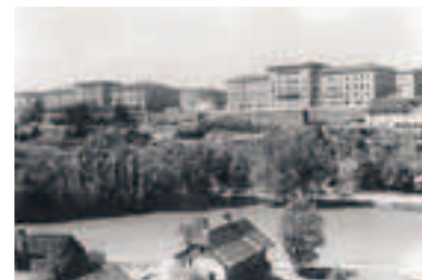
Die beiden Flügel noch ohne den zentralen Kuppelbau.