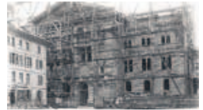
Das Parlamentsgebäude im Bau.